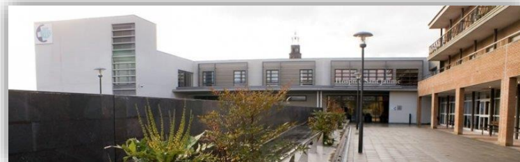
Hospital Sant Jaume de Manlleu