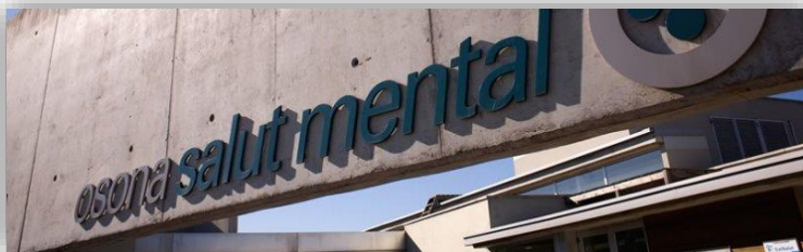
Osona Salut Mental