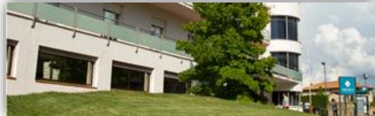
Clínica de Vic