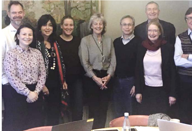
Imatge: General Board HPH Internacional